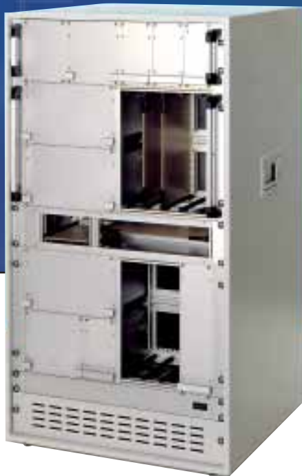
Konfigurationsbeispiel: 20 HE